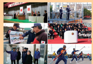
■表紙 本号掲載記事より